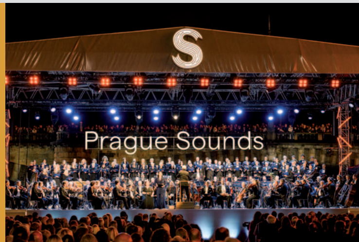
Koncert pro Evropu a plovoucí scéna na Vltavě

88. sezonu zahájil Pražský filharmonický sbor 2. 9. 2022 Koncertem pro Evropu. V rámci spolupráce s festivalem Prague Sounds a Českou filharmonií se koncert konal při příležitosti českého předsednictví v Radě Evropské unie. Příprava a organizace koncertu proběhla v součinnosti s Úřadem vlády ČR. Koncertu se účastnili vrcholní političtí představitelé států. Jednalo se o historicky první koncert ČF a PFS přímo na hladině Vltavy a doposud největší koncert na Vltavě. Na 170 účinkujících vystoupilo na plovoucí scéně. Kapacita hlediště byla 1 200 diváků. Plovoucí scéna byla situována do blízkosti Národního divadla a Slovanského ostrova, a to na vzduší Staroměstského jezu, tzv. Vltavské zrcadlo. Koncert bylo možné také sledovat z mostů sousedících ostrovů, vltavského nábřeží a z lodiček a šlapadel na Vltavě. Jedinečnou atmosféru přenášely kamery České televize, kromě domácího vysílání se přenos objevil také v zahraničních médiích. Pražský filharmonický sbor se představil pod taktovkou Semjona Byčkova ve stěžejním díle večera, Janáčkově Glagolské