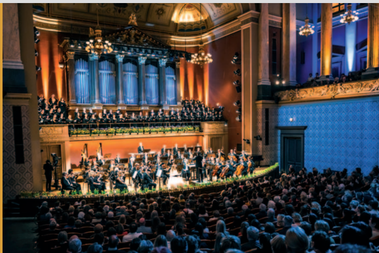
Symbolická podpora Ukrajiny se na Jarním koncertě promítla i do zabarvení Dvořákovy síně.

rokem PKF—Prague Philharmonia. Koncert byl živě streamován na facebookových stránkách PFS a ČT art. Koncert, který se konal měsíc po vypuknutí ruské invaze na Ukrajinu, byl věnován právě na podporu Ukrajiny. Na začátku večera zazněla česká a ukrajinská hymna a cappella (v podání PFS a několika ukrajinských zpěváků), projevy pronesli ministr kultury ČR pan Martin Baxa a velvyslanec Ukrajiny pan Jevhen Perebyjnis s manželkou. PFS se připojil ke sbírce, kterou organizovalo velvyslanectví Ukrajiny v ČR (publikum v Rudolfinu mohlo přispět do sbírky prostřednictvím QR kódu vloženého do programu koncertu).