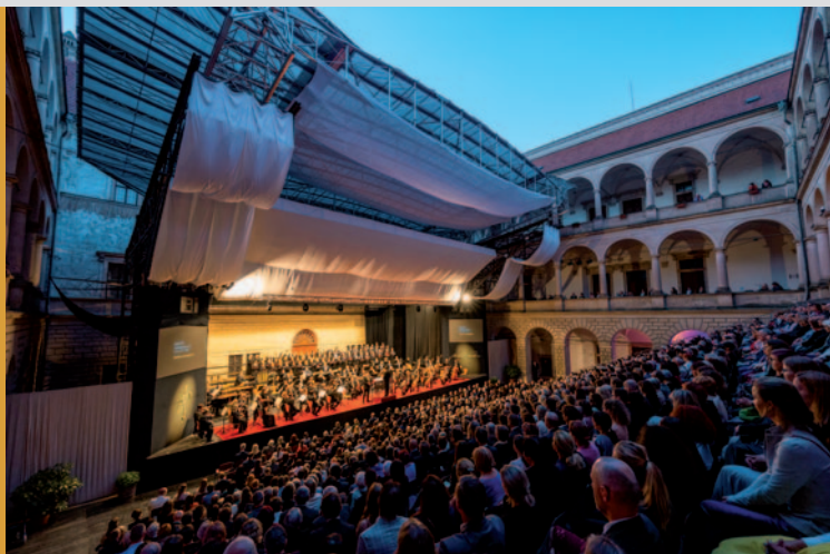
Smetanova Litomyšl je festival, kde sbor pravidelně účinkuje.